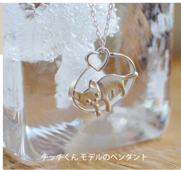
チッチくん モデルのペンダント

いつも Cat more Cat のInstagramをご覧くださいありがとうございます！